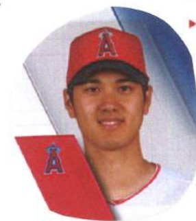
Ohtani Tracker Angels 5, Royals 4

Sho Time こと大谷翔平君の活躍が各報道を賑わしています。4月15日現在、又勝本塁打。23歳の若者に対し我が身の輝きはもう皆無。さてどうしたものか？ 心技体という言葉があります。もともとは明治の柔術の言葉とのこと。その柔術の目的として、1. 身体の発育 2. 勝負術の鍛錬 3. 精神の修養を挙げていたと。つまり、「体・技・心」先立つものは心ではなくて体であると。健康な状態はメンタルを安定させやすいと私自身もしおちやう思います。まずは健康のための時間をリョタイムとします。(L)