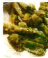
ネギ坊主の天ぷら